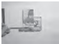
「テーブルコーダー」