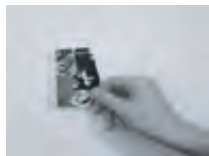
「もうすこしくっついて」