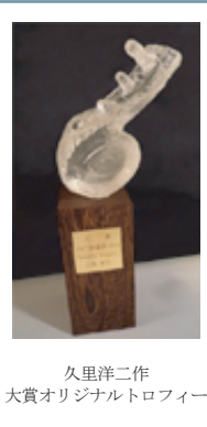
久里洋二作 大賞オリジナルトロフィー