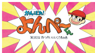
2018年 しよーた「がんばれ! よんぺーくん」