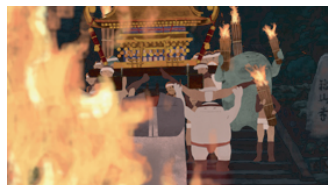
2017年 谷 羅介「くらまの火祭」